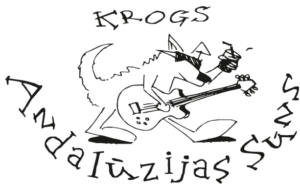
Andalūzijas Suns logo no 1999. līdz 2014. gadam