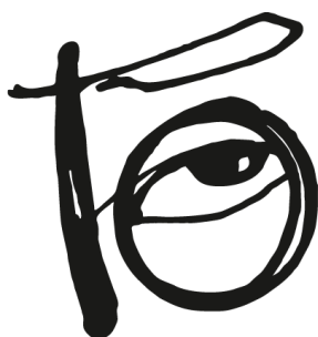
Andalūzijas Suns logo no 1995. līdz 1999. gadam